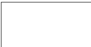
Cedula antes de la votación

Paso 5. En la cedula de sufragio se deberá colocar el número del candidato de su preferencia, pudiendo colocar solo un número.